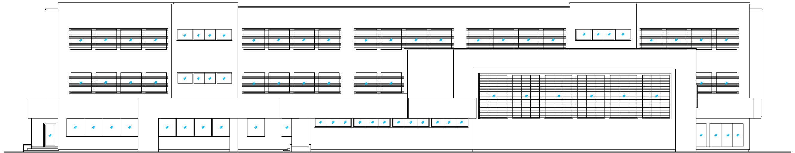
ELEWACJA POŁUDNIOWA - WIDOK Z SALI GIMNASTYCZNAJ